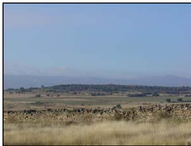
Castille-Leon – Astorga