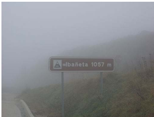
Passage du Col d'Ibañeta