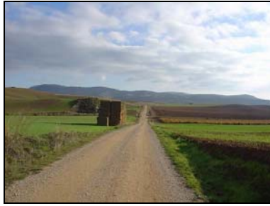
Navarre – Los Arcos