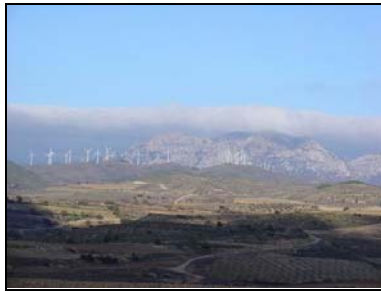
Navarre – Torres del Rio