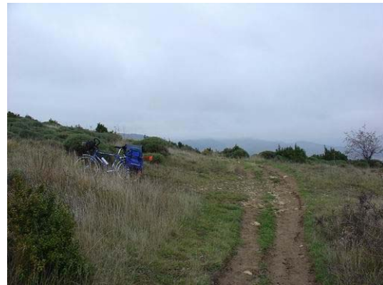
Ascension du col du Perdón

Les discussions au fil des rencontres dans les auberges avec des randonneurs m'ont décidé de laisser une plus grande place au chemin. Ainsi, dès le deuxième jour, je me suis lancé à l'assaut du chemin et du passage d'un col par celui-ci ! Outre la tranquillité, l'étape fut vraiment enrichissante ; autant sur la maîtrise de l'effort physique, que sur les frissons (freinage in extremis à 30cm de plus de 100m de vide) et sur le bonheur éprouvé à se retrouver seul sur le chemin loin de tout être humain et au plus près de la nature. J'ai vraiment senti à ce moment la chance que j'avais de pouvoir réaliser un de mes rêves.