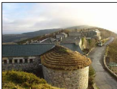
Galice – Cebreiro

Les particularités du chemin de Saint-Jacques sont la prise de conscience du temps qui passe mais aussi l'enrichissement à travers les rencontres d'autres pèlerins.