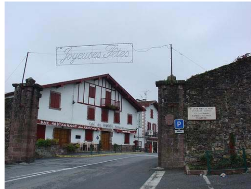
Sortie de Saint-Jean Pied de Port

Le voyage a débuté le samedi 4 décembre à partir de Saint-Jean Pied de Port, avec un temps humide et nuageux. Mais durant les premiers tours de pédales une vive émotion montait en moi : « je ne sais pas ce que je vais rencontrer mais en tous cas je suis seul pendant deux semaines pour réaliser ce que je peux à mon rythme ! ». Me voilà ainsi parti pour la première étape en commençant par 22 Km d'ascension dans le brouillard. Sans aucune connaissance pratique d'une telle étape de cyclo-randonnée, j'adopte un rythme tranquille pour assurer la réussite de la journée.