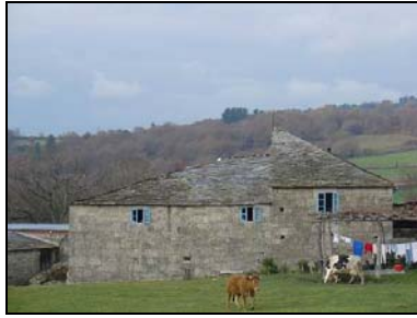
Galice - Vilar

Sans oublier, ce marseillais parti du Puy-en-Velay. Dans la même situation professionnelle que moi, il se prépare pour réaliser la route de la soie en solo et...à pied ! En évoquant nos prévisions d'étapes, nous pourrions nous rencontrer en Turquie ! Enfin, dans la rubrique nostalgie, j'ai rencontré un hispano-américain alpiniste professionnel dans l'état d'UTAH. Son expédition pour un sommet himalayen a été annulée mais se prépare pour la prochaine expédition en juin. Avant de venir dans les alpes, il souhaitait se faire les jambes avec le chemin. Comme le disait l'aubergiste bénévole, on rencontre vraiment de tout sur ce chemin !