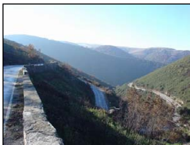
Castille-Leon – Molinaseca